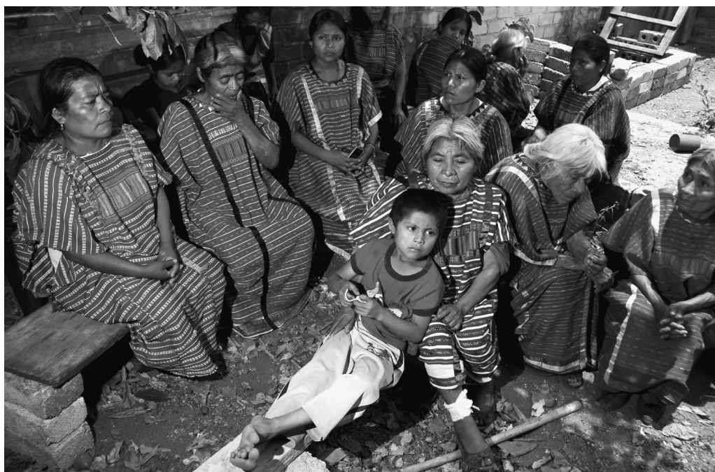
▲ Versuch der indigenen Selbstverwaltung abgewürgt Außerhalb ihrer Häuser werden Frauen häufig bedroht

denen die Flucht gelang, um nicht-indigene Auftragsmörder aus dem Nachbarbezirk. Laut Aussage des Sprechers von MULTI, verkehrten die als Händler getarnten Mörder bereits seit eineinhalb Monaten in der Gemeinde, um Waren zu verkaufen. Dies lässt vermuten, dass der Mord schon vor der Karawane vom 27. April geplant wurde. Die MULTI bezeichnete die MULT als verantwortlich für den Doppelmord. Andere Stimmen wie Miguel Badillo, Chefredakteur von Contralínea, sehen darin ein klares „Staatsverbrechen“, um mit einer Person abzurechnen, welche sich als zu