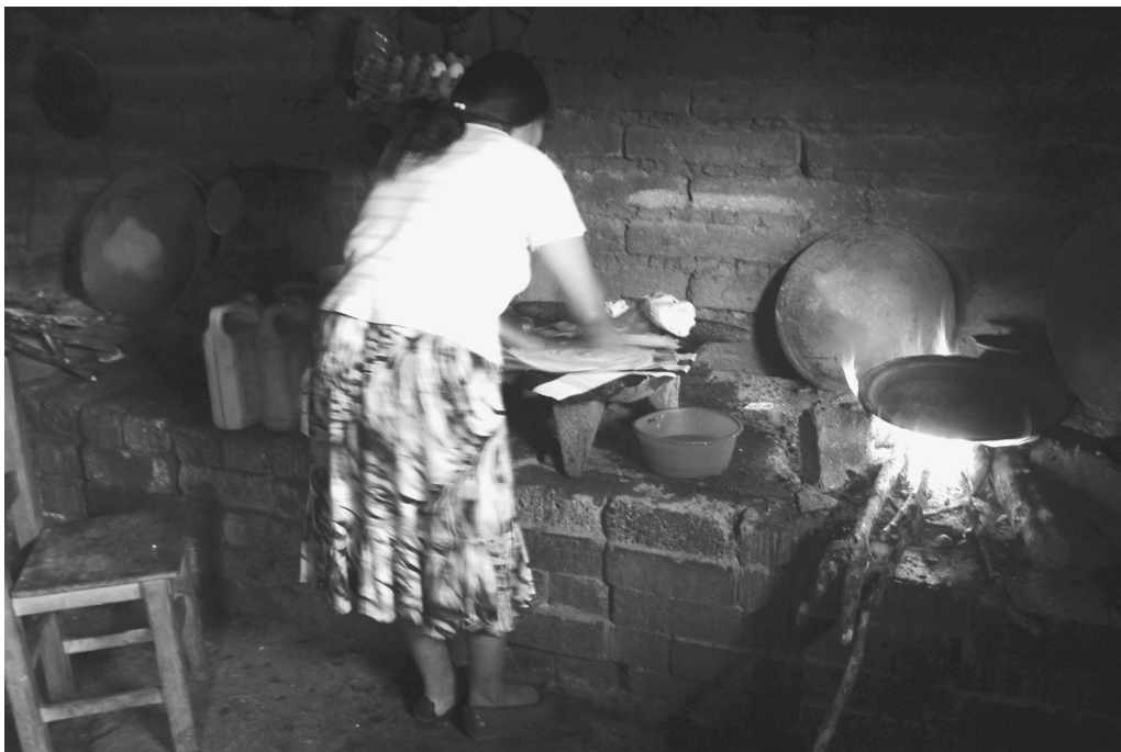
▲ Kein einfacher friedlicher Alltag Frau beim Zubereiten einer Mahlzeit