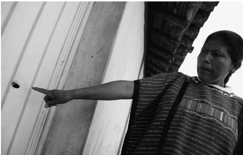
▲ Von Paramilitärs belagert Einschusslöcher in einem Haus in San Juan Copala

letzten drei Jahrzehnte mit den zentralen Konfliktparteien MULT, UBISORT und MULTI (Bewegung der Vereinigung und des Kampfes Triqui Independiente), und deren Kampf um politische Macht sowie der Verteilung von staatlichen Unterstützungsgeldern ist nur vor diesem Hintergrund zu verstehen.