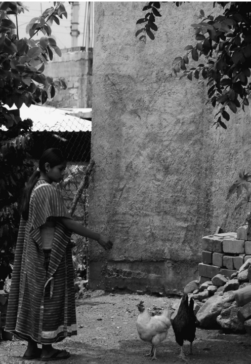
▲ Alltag versuchen Hühner wollen gefüttert werden

Es ist kein leichtes Unterfangen, die historischen Wurzeln der Auseinandersetzung sowie das aktuelle Konfliktfeld zu verstehen. Nur wenige Quellen sind einigermaßen zuverlässig, zudem handelt es sich meist um Beschreibungen von Außenstehenden. Tatsache ist, dass die politische Gewalt in der Triqui-Region bereits seit Jahrzehnten andauert. Die Triquis, wie auch die anderen indigenen Völker Mexikos, litten in den Jahrzehnten vor und nach der mexikanischen Revolution (1910 bis 1917) unter systematischer Landenteignung durch GroßgrundbesitzerInnen und mestizische Gemeinden. Die letzte größere Konfrontation der Triquis mit dem Staat datiert aus der Mitte des 20. Jahrhunderts, als Militärs und Händler ein blühendes Tauschgeschäft Kaffeebohnen gegen Schnaps, Waffen und Munition betrieben. Militäreinheiten beschlagnahmten die Waffen, nur um sie dann den Indigenen erneut zu verkaufen. Eines Tages ermordeten erzürnte BewohnerInnen von San Juan Copala mehrere Soldaten. Als Antwort beschossen Militärflugzeuge die Hütten von Copala und der mexikanische Staat entzog Copala den Status des Bezirks. Seither sind alle Triqui-Indigenen auf die drei umliegenden mestizischen Bezirke aufgeteilt und nicht als eigenständige Verwaltungseinheit anerkannt. Die Entwicklung der