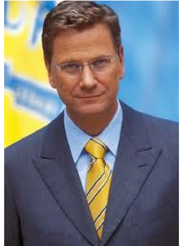
Westerwelle: Mitte Juli