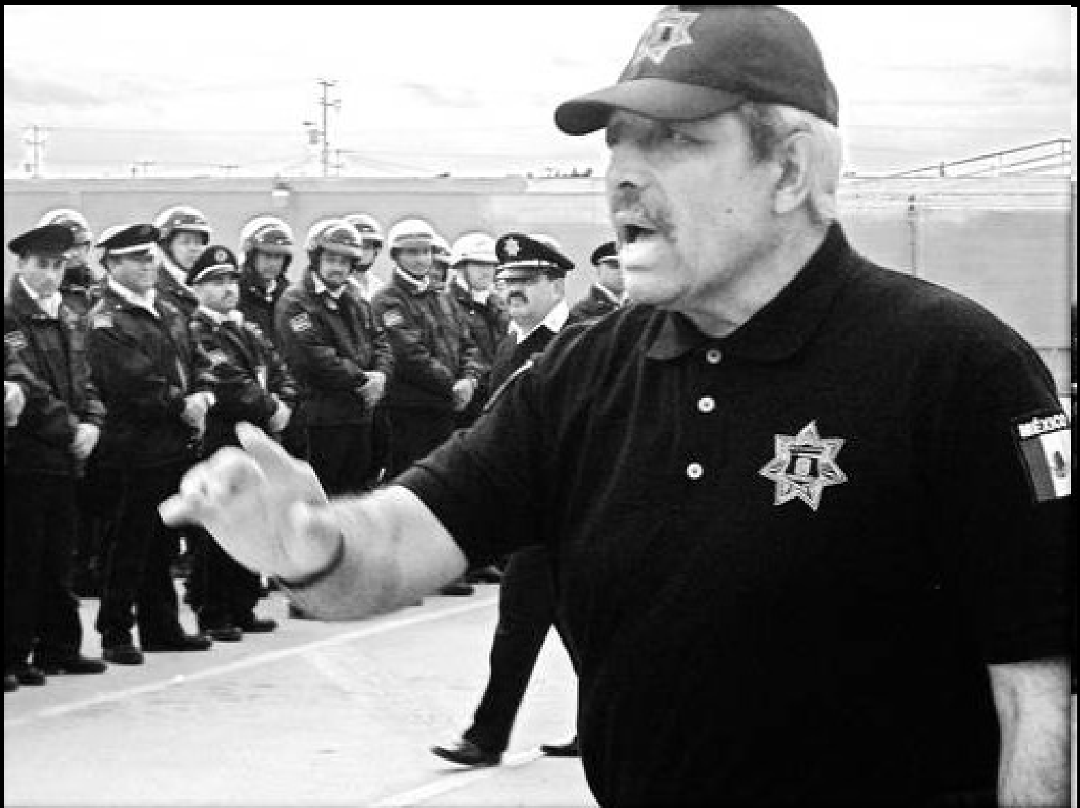
Brigadegeneral Carlos Villa Castillo: propagiert unbehelligt extralegale Hinrichtungen